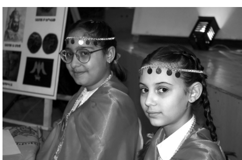
ռում, որի մասին դեռ շատ կիչեն հատկապես մասնակից դպրոցականները, որոնք «Կողբինդ ո՞վ է» հարցին արդեն գիտեն պատասխանել. «Ես եմ...»: