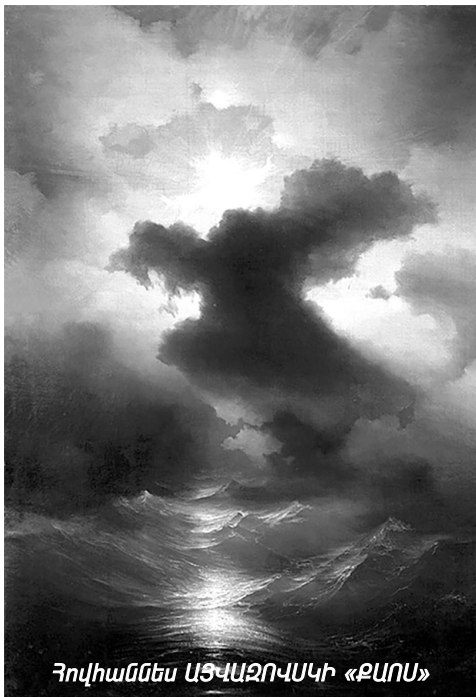
Հովհաննես ԱՅՎԱԶՈՎՍԿԻ «ՔՍՈՍ»