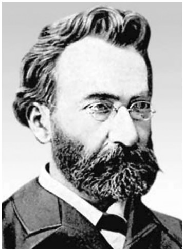
Ջարմանալի բան է հույսը:

Նա մարդերի մեջ հայտնվում է երկու կերպարանքով. մեկ, որ մարդը գործում է, աշխատում է և ամենակին չէ թուլացնում իր եռանդը, և հույս ունի, որ կհասնի իր նպատակին: Մյուս, որ մարդը ոչինչ չէ շինում, ծուլ է, հանգիստ իր տեղը նստած է և հույս ունի, թե մի օր կստանա այն, ինչ որ ցանկանում է: