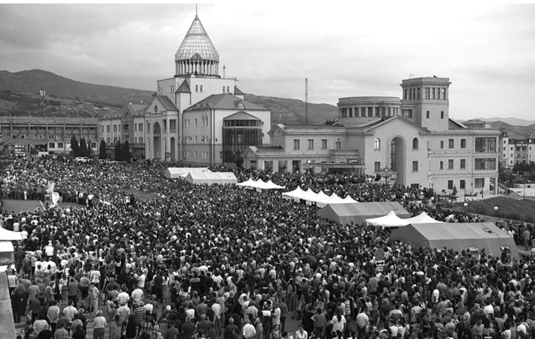
ԱՐՑԱՄԻ ՎԱՃԱՌՔԻ ԵՆԹԱԿԱ ՉԷ

Ամբողջությամբ կամ մասնակի ներկայացնում ենք հնչած ելույթներից մի քանիսը, որոնք լավագույնս են բնութագրում Արցախի մաքառումը և մեր ժողովրդի կամքը: