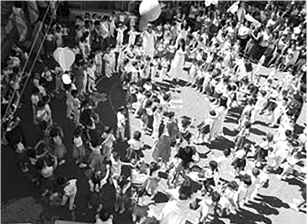
ԱՅ ԿԳՄՍՆ ՆԱՃԱՐԱԿԱՐԳՐՈՑԿԱԿԱՆ ԿՐԹՈՒՅԱՆ ԲԱԺԻՆ

Սիրելի՛ փոքրիկներ, թող կանաչ ու լուսավոր լինի ձեր անցնելիք ճանապարհը, թող հաջողության աստղը