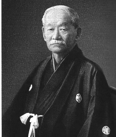
Ջիգարու Կանո, մարտարվեստների վարպետ, Չյուդոյի հիմնադիր

17-րդ դարի սկզբին ճապոնիայում դադարել էին ներքին կռիվները: Անվերջանալի ճակատամարտերի դարաշրջանը մնացել էր անցյալում, գրահն այլեւս պետք չէր: Մինչդեռ մարտարվեստները շարունակում էին զարգանալ: Ավելին, գրահի բացակայությունն ավելացրել էր ճակատամարտողների հնարավորությունները: Այդ ժամանակաշրջանին է հարիր առանց զենքի օգտագործման մարտ վարելու արվեստի ծաղկումը: Այն ժամանակ է ծեւավորվել ջուջուցուի տեխնիկան, որը հետագայում դարձել է Չյուդոյի հիմքը: Ճապոնեցի թարգմանաբար «ջուջուցու»՝ նշանակում է փափկության արվեստ: Այդ անվանումը ճշգրտությամբ բնութագրում է տվյալ տեխնիկան: Ջուջուցուի հե-