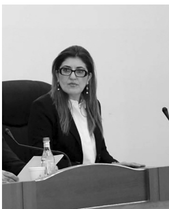
Արցախի Հանրապետության Ազգային ժողովի մեծարգո նախագահ,

Համաժողովի կազմակերպիչ հարգելի անդամներ, հարգելի մասնակիցներ, գործընկերներ