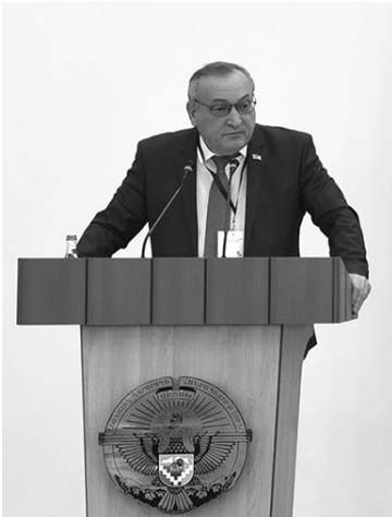
Հարգելի նախագահող, Համաժողովի մասնակիցներ, հյուրեր

Ողջունում եմ բոլորիդ Ազգային ժողովի հյուրընկալ օջախում և խորապես կարևորում «Արցախյան հիմնախնդիրը արդի քաղաքական գործընթացների հոլովություն» խորագրով գիտագործնական համաժողովի նախաձեռնումն ու կազմակերպումը: