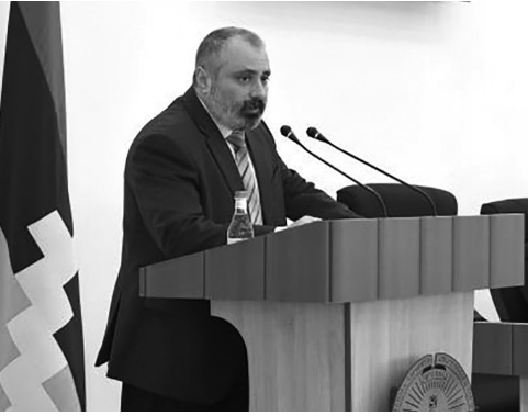
«Արցախյան հիմնախնդիրը արդի քաղաքական գործընթացների հոլովություն» գիտազործնական խորհրդածրոյվում «ԱՅ արտաքին քաղաքականության գերակա հիմնախնդիրները արդի քաղաքական գործընթացների հոլովություն» թեմայով զեկուցումով հանդես եկավ ԱՅ արտաքին գործերի նախարարի պաշտոնակատար, պատմական գիտությունների դոկտոր Դավիթ ԲԱԲԱՅԱՆԸ: Այն ներկայացնում ենք ընթերցողների ուշադրությանը: