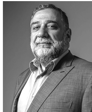
Հարգելի նախագահող, Համաժողովի մասնակիցներ, հյուրեր

« Ա Ր Գ Վ Խ Ի շուրջ ընթացող բարդ աշխարհաքաղաքական զարգացումներում, երբ առեւտրային լուծում ենք լրջագույն մարտահրավերների, նման համաժողովի անցկացումն Ստեփանակերտում առանձնահատուկ կարևորություն ունի: