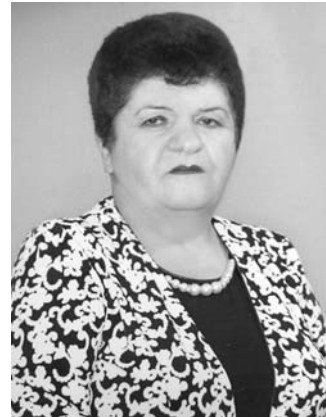
Երեխաներին դասավանդող ուսուցիչը հարգանքի է արժանի ավելի, քան ծնողը, որին երեխան պարտական է լոկ իր ծնունդով: Մեկը մեզ կյանք է պարգևում, մյուսը՝ արժանավոր կյանք: