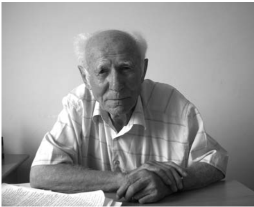
Ով շատ է սիրում, նա կարոտում է, կարոտը կշիռ, չափ չի ճանաչում:

Ֆեյսբուքյան ընկերոջս՝ բանաստեղծ Կարեն Արամյանի «Կարոտս» բանաստեղծությունն տողերն են, որոնք շատ հուզեցին իմ հոգեկան աշխարհը: