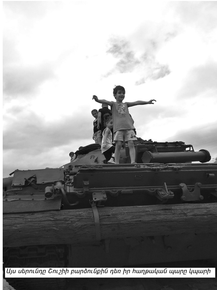
Այս սերունդը Շուշիի բարձունքին դեռ իր հաղթական պարը կպարի

Այս երկխոսությունը կարող էր և չլինել, բայց եղավ ու շատ տպավորիչ էր: Անկեղծ ասեմ՝ ապագայի հանդեպ նոր հույսերով լցվեցի: Երկխոսությունը մայրաքաղաքի դպրոցներից մեկում սովորող շուշեցի մի պատանյակի հետ էր, որը հրաժարվում էր իր տարիքն ասել, բայց դա երևի այնքան էլ էական չէ: Հուսամ՝ դուք էլ կտպավորվեք ինձ պես: