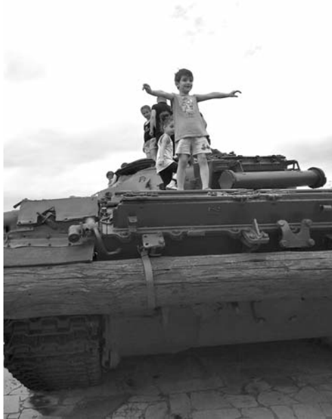
Նա դեռ արծվի ճուտ է, և նրա թռիչքն առայժմ պար է հաղթական, բայց երբ մեծանա, ու թևերը հզորանան, անպայման կսականի դեպի հայոց բարձունքներ՝ Մոռվ, Նեմրուք, Արարատ: Կզմա՝ գերությունից ազատելու մեր սրբալեռները...