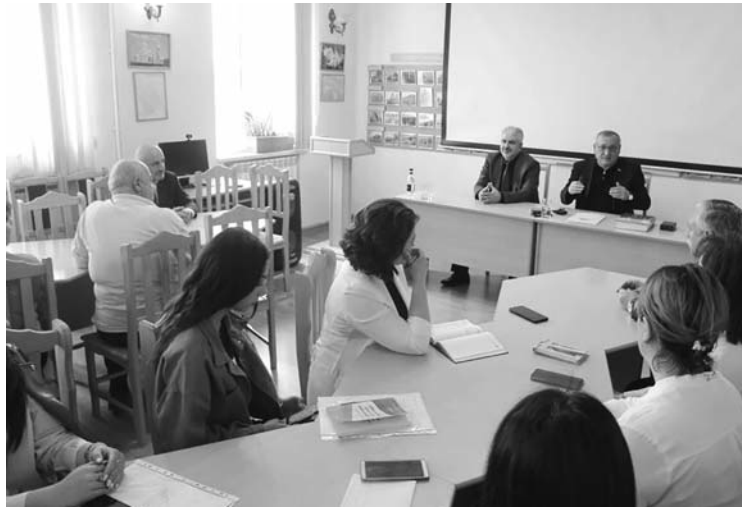
Արցախի պետական համալսարանում մեկնարկել է «Արցախ. ներկան և ապագան» ծրագիրը, որի շրջանակում քննարկման են հրավիրվում հասարակական, քաղաքական գործիչներ, մտավորականներ: Այդ շարքից առաջին հանդիպումը ապրիլի 20-ին

Հաշվետու տարում ԱրՊՀ կատարած աշխատանքները ներկաները գնահատեցին բավարար: