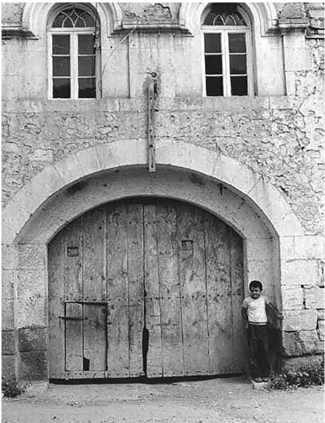
Մելիք Մնացականյանի տունը Գետաշենում

Այդ գյուղում են իջևանեցի Մելիք Մնացականովների տա-