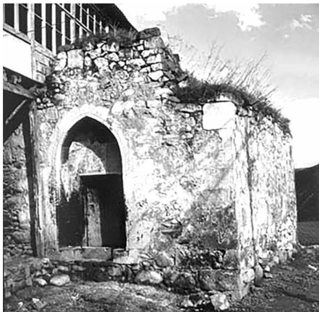
Մուրը Նշան մատուռը Գետաշենում

Երկար որոնելուց հետո գտան քահանային, որ եկավ մատուռի դուռը բաց արավ: Գանապարհին իմ ուղեկից տեր Գ. Բ.-ն պատմեց մի նոր պատահած անցք, որից ես հասկացա, թե ինչպես պետք էր վարվել այդ մատուռի մեջ: Ամենայն երկյուղածությամբ մոտեցա, երեսու խաչակնքելով համբուրեցի ս. Ավետարանը և այլ սրբությունները, որ կարգով շարած էին սեղանի վրա: Հետո խնդրեցի քահանային, եթե կարելի էր, ինձ ցույց տալ գրչագիր Ավետարանը: Որովհետև մատուռի մեջ