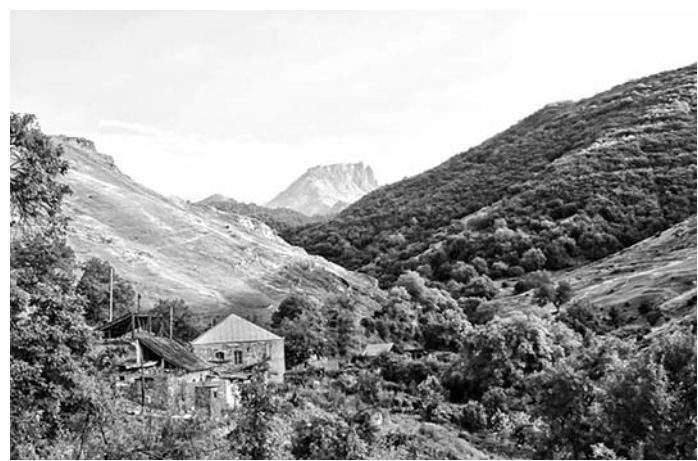
Կեպաս լեռը հայկական Մարտունաշենից

սեղանի պաշտոնանքներից մեկին, որ իր ապրուստի հույսը չէր դրել միայն պսակից, մկրտությունից և թաղումից ստացած փողերի վրա, այլ ապրում էր արդար արհեստով և գյուղացու