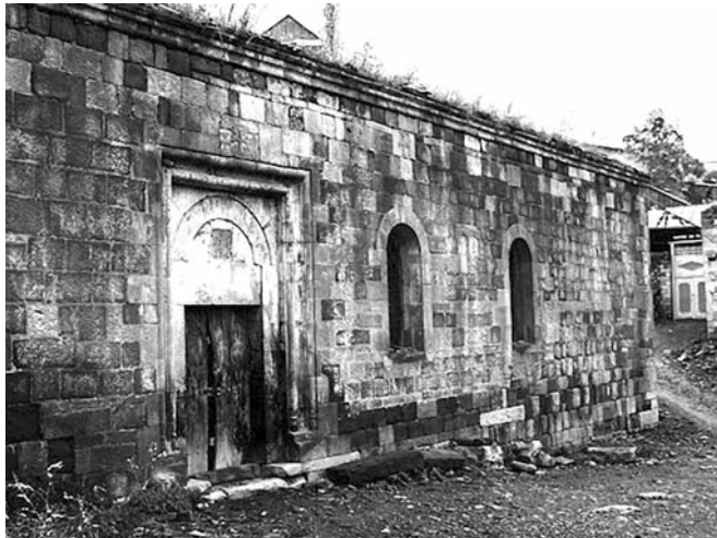
Գետաշենի Ս.Սարհան եկեղեցին

Գետաշեն գյուղը ունի մի քարաշեն եկեղեցի և մի մատուռ, որ ուխտատեղի է. նա կոչվում է ս. Նշան: Եկեղեցին ես չգնա-