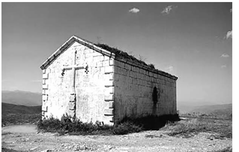
Պանդայրոնի մատուռը կանգուն ժամանակ

հայոց մատուռ, որի մեջն է ս. Պանդայրոն բժշկի գերեզմանը: Նույն լեռան արևելյան կողմը, մի ծորի մեջ գտնվում է հայոց վանք, որի մեջն է Հերմոգիմե քահանայի գերեզմանը: