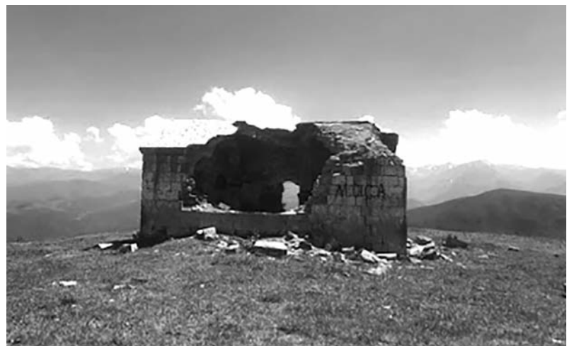
Պանդայրոնի մատուռը 2020 թվականին