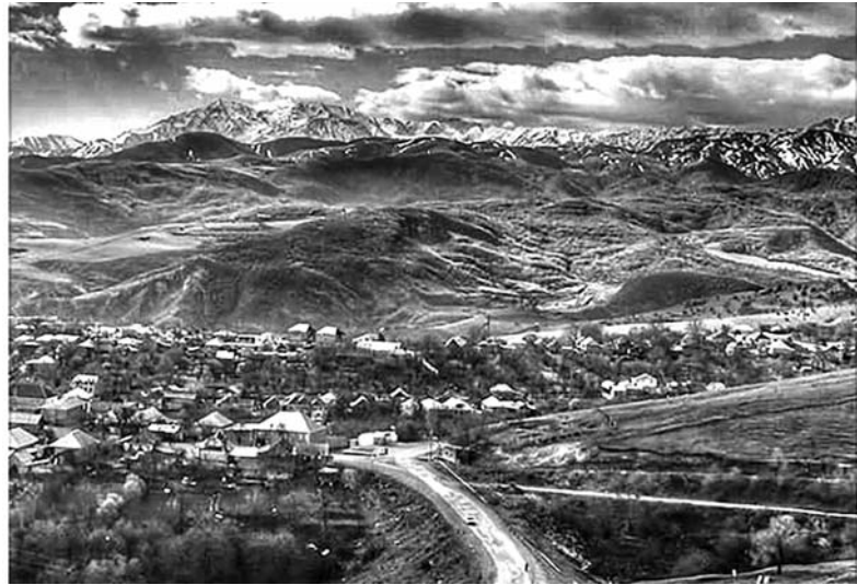
Ազատ գյուղը: Գյումրիից Արցախ

Հետո առա ինձ հետ, որպես ուղեցույց, գյուղացիներից մեկին, իսկ որպես առաջնորդ Սարգիս Ջալալյանցի ծանապարհորդության երկու հատորները: Շուտով հայտնվեցավ, որ այդ գրքերը միևնույն տեսակ բաներ էին, որպես թիֆլիսի շտաբի