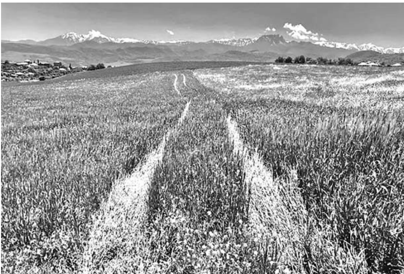
Հաջիշենի տեսարան: Հեռվում Կեպաս-Ալիարակ լեռն է

Գանձակի ամառանոցն է. այնտեղ է անցկացնում ամառը զավառապետը իր բոլոր ծառայողներով, այնտեղ են լինում քաղաքի բոլոր պաշտոնատարները: Գանձակից մինչև այստեղ բերած է հեռագրական թել, Հաջի-քենը այժմ բացի ամառանոց եկողներից ուրիշ բնակիչներ չունի: Բայց նա առաջ եղել է հայաբնակ գյուղ, մինչև այսօր մնացել է հայոց եկեղեցին, որ կիսով չափ ավերակ է: Գյուղից ոչ այնքան հեռու, անտառի մեջ երևում է հայոց գերեզմանատունը: