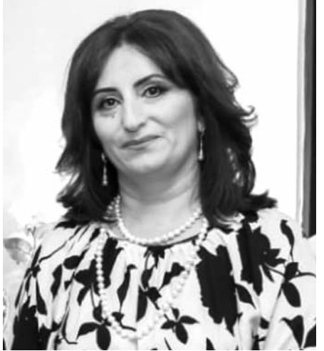
Ուսուցիչների ամբողջ հպարտությունն աշակերտների մեջ է, իրենց ցանած սերմերի մեջ: