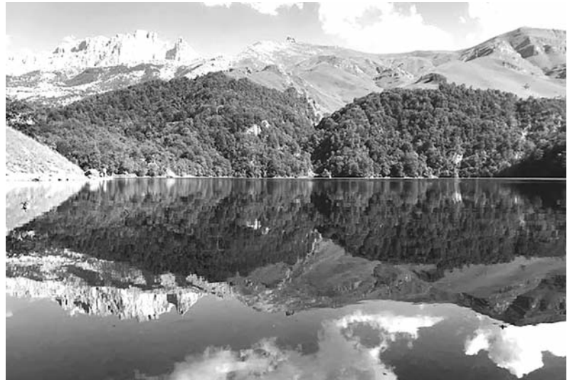
Կեպաս լեռը, Մարալի Կանաչ լիճը

Քյափազ սարի փլատակները, դիզելով ահագին քարաժայռեր միմյանց վրա, կազմել են բազմաթիվ խռոչներ և այրեր, որոնք մեծ ծառայություն են արել բնակիչներին երկրի խռովյալ ժամանակներում: Այդ այրերի մեջ պատսպարվում էր հայ ժողովուրդը լեզգիների, պարսիկների և օսմանցիների արշավանքների ժամանակ: Այնտեղ, ուր գտնվում է Քյափազ լեռան քարակարկառը, կոչվում է Չինգիլ, այսինքն չանկ, որ նշանակում է անկարգ կերպով դիզված քարեր: Չնայելով, որ Քյափազ սարի մի մասը քանդվել է, բայց նա դարձյալ բարձրաբերձ հանդիսանում է իր շր-