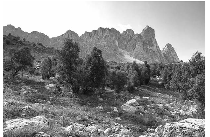
Կեպաս լեռան քարակույտերը

րից, ես կրկին եկա Ազատ գյուղը, ուր իջևանել էի: Այդ գյուղը գտնվում է լեռան բարձրավանդակի վրա, նրա դեպի արևմտյան (?) կողմը բարձրանում է Սարիյալ կոչված սարը, որի գագաթի վրա կա մի հա-