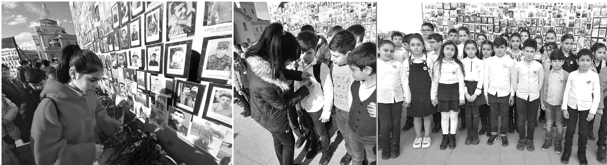
Ստեփանակերտի Խ. Արուվյանի անվան հ. 1 դպրոցի 5-րդ դասարանի աշակերտներն այցելեցին Ստեփանակերտի Վերածննդի հրապարակում արդեն հուշակոթող դարձած վայրը և երգվեցին ու անցան «Ձարթոնք» մանկապատանեկան կազմակերպության «Արծվիկների» շարքերը: Նրանք խոստացան, որ գիտելիքներով կզինվեն ու կստեղծեն այն հզոր երկիրը, որի մասին երազում էին հերոսացած տղաները: Փառք Հայոց բանակին, հավերժ փառք ընկածներին: