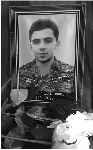
Որպեսզի ցեղդ ու հայրենիքդ ապրեն, նրանց համար մեռնելու կամք ունեցիր: Իբրև հայ մարդ անպետք է նա, ով չունի այդ կամքը: