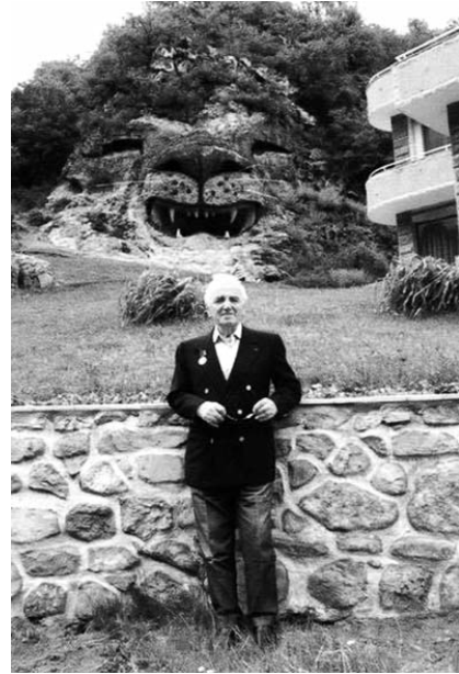
սերտ էր. ամբողջ կյանքը ապրելով Ֆրանսիայում՝ երբեք չի մոռացել, որ հայ է: Նրա տիեզերական մեծությունը տեսանելի էր