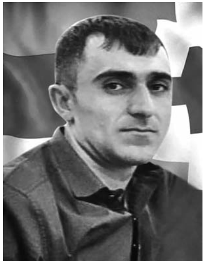
Չայրենիքը սիրում են ոչ թե խոսքով, այլ գործով: Ինչ որ ունեի, տվի հայրենիքիս...

44-օրյա պատերազմը փոխեց բոլորիս կյանքը՝ դարձնելով այն ավելի իմաստազուրկ, աննպատակ ու անորոշ, քան պատերազմից հնարավոր էր: Կորուստներն այնքան մեծ էին ու անդառնալի (այսօր էլ դեռ շարունակվում են), որ քիչ էր մնում՝ մարդ խելագարվի, գլուխը պատեպատ խփի՝ չհասկանալով, թե հանուն ինչի ունեցանք այդ ահռելի ու անիմաստ կորուստները: