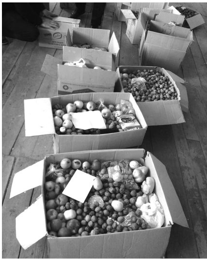
Գիկներ են ուղարկել, մաղթել նրանց առողջություն, քաջություն, բազկի գորություն ու ծառայության ընթացքում միմիայն հաջողություններ: Մենք մեր պատմությամբ, ներկայով ու

Մարտունու շրջանի Թաղավարդի Աշոտ Գրաշու անվան միջնակարգ դպրոցում Հայոց բանակի կազմավորման 28-րդ տարեդարձի նախօրեին ուրախ եռուզեռ էր: Չնայած դրան ցուրտ ծնեռ էր ու ծյուն, մեր հոգիներում ջերմություն կար: Այդ օրը երեխաները դպրոց էին հաճախել ոչ սովորական. պայուսակների հետ փաթեթներ ու տոպրակներ էին բերել՝ լի ամուշահամ մրգերով ու քաղցրավենիքով: