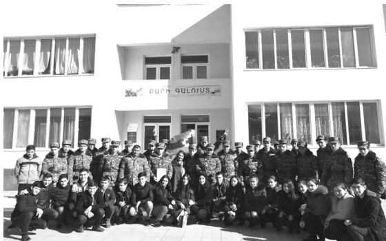
Առաջնակարգ տեղեր են գրավել Վազգենաշենի «Արաբո», Մարտունու և զորամասի «Արիս» թիմերը: Հաղթող թիմերը պարգևատրվել են պատվոգրերով եւ խորհրդանշական նվերներով:

ՀՀ Արցախի պատանեկան միության վարչության նախաձեռնությամբ Մարտունու շրջանի Գիշու միջնակարգ դպրոցում կազմակերպվեց «Պիտի գնանք վաղ թե ուշ» խորագրով ինտելեկտուալ խաղ՝ նվիրված Արցախյան ազատամարտի հերոս Սերժիկ Շամամյանի ծննդյան 65-րդ տարեդարձին: