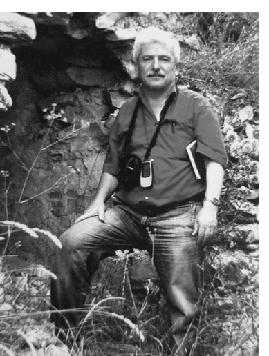
Միլվա ՄԻՆԱՍՅԱՆ Բ.Գ.Թ.

հիշում: Այսպիսով՝ Ս. Սարգսյանի նոր հրատարակած արցախյան տեղանունների ծագումնաբանությանը նվիրված «Արցախյան բնակավայրեր» մեծարժեք աշխատությունը լուրջ ներդրում է հայ լեզվաբանական, պատմագիտական, աշխարհագրական գիտությունների բնագավառում, համարձակ քայլ հազարամյակներ առաջ մարդկության գործածած որոշ բառերի պատմական ստուգաբանության վերաբերյալ, որոնք երկու ուղղությամբ են իրացվել՝ 1. եղած անունների ճշգրտում և ստուգաբանություն, 2. եղած անունների սկզբնականի վերականգնում ու ստուգաբանություն: