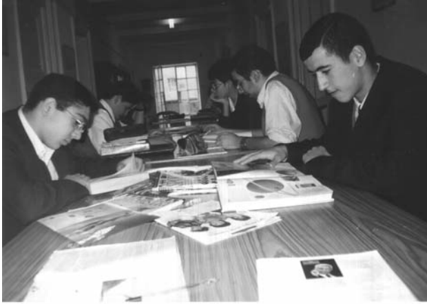
17 ապրիլի, երկուշաբթի

Գիտե՞ք, շատ ժամանակ երբ ասում են, որ պետք է գրեմ մի օրվա մասին, ընդհանրապես գրելու տրամադրություն ունենում են: Բայց շատ գրելուց հետո ծանծաղում են, սակայն ինձ վրա պարտականություն են զգում լրացնելու: Ու երբ տրամադրված են լինում գրելու, կարողանում են մանրամասնորեն պատմել: Բայց հիմա, մի քիչ շատ գրելով, շտապում են գրել-վերջացնել, որ ազատվեն: