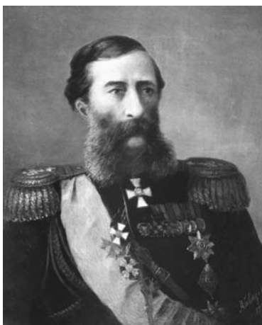
Միքայել Լոռիս Մելիքով, Ռուսաստանի վարչապետ և դիկտատոր

Յետագայում ես, հատկապես XIX դարի երկրորդ կեսերին, հայ պետական և քաղաքական գործիչներն անջնջելի հետք են թողել Եգիպտոսի պատմության մեջ: Բավական է նշել, որ XIX դարի 80-ականներին Եգիպտոսի առաջին վարչապետը եղել է Նուբար Նուբարյանը, որն անգնահատելի դեր է խաղացել Եգիպտոսի ակախության և ինքնության պահպանման գործում: Բացի դրանից, դարձյալ XIX դարում հայերը բազմիցս զբաղեցրել են Եգիպտոսի արտաքին գործերի նախարարի պաշտոնը և կարելու դեր խաղացել կառավարական համակարգի այլ բնագավառներում: