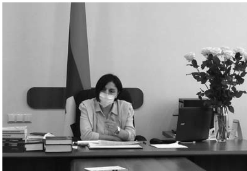
ԱՇԽԱՏԱՆՔԱՅԻՆ ՄԻ ՔԱՆԻ ՍԿԶՐՈՒՄԵՆԵՐԻ ՄԱՍԻՆ

Յուլիսի 15-ին և 16-ին ԱԶ կրթության, գիտության և մշակույթի նախարար Լուսինե Ղարախանյանը խորհրդակցություն է անցկացրել Ստեփանակերտում գործող մանկապարտեզների և հանրակրթական դպրոցների տնօրենների հետ: Մասնակցում էին նախարարության և քաղաքապետարանի համապատասխան ոլորտների պատասխանատուներ: