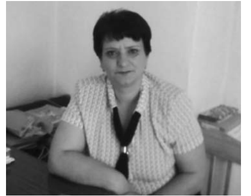
Ամենակարևոր երևույթը դպրոցում, ամենաուսուցանող առարկան, ամենալավ կենդանի օրինակը՝ այս ամենն ամբողջանում է ուսուցչի մեջ: