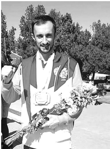
Ծնվել է - հոկտեմբերի 21, 1992թ.: Մարզածերը - ավանդական կարատե-դո: Սկսել է պարապել - 3 տարեկան էր, երբ հաճախում էր պարապմունքի, 6 տարեկանում հանձնեց առաջին բնութայինը: Կարգախոսը - «Ինքնաճանաչում, ինքնազարգացում»: Չեմպեոնները սպորտում - 2019թ. ավանդական կարատե-դո

Եվրոպայի առաջնության հաղթող, 2013թ. ավանդական կարատե-դո Եվրոպայի առաջնության 3-րդ տեղի մրցանակակիր, միջազգային մրցաշարերի բազմակի մրցանակակիր, 33 բազմակի չեմպիոն տարբեր մրցաձևերով: Մասնագիտությունն ու աշխատանքը - «Գրիգոր Լարեյկացի» համալսարանի ֆիզկուլտուրա բաժնի 2-րդ կուրսի ուսանող, Ասկերանի ՄՊՄԴ-ի կարատեի մարզիչ, Արցախի ավանդական կարատե-դո ֆեդերացիայի մարզիչ: Սիրում է զբաղվել - մարտարվեստով, քանդակագործությամբ: Կյանքում ամենից շատ սիրժեւորում է - ընտանիքը: Մարզիկը պետք է լինի - աշխատասեր, նպատակասլաց, ինչը զրկում է ազատ ժամանակից, բայց տալիս է արդյունք: Նրա համար օրինակելի մարզիկները - կարատեի վարպետները, որոնք նույնիսկ մեծահասակ ժամանակ գտնվում են ֆիզիկական եւ մտավոր գերազանց վիճակում, ինչն արտահայտվում է նրանց կողմից անցկացվող սեմինարների ժամանակ եւ առհասարակ կյանքում: Ընտանեկան կարգավիճակը - ամուսնացած է, ունի դուստր: