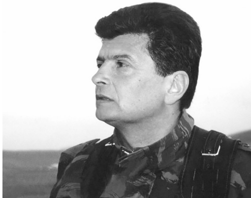
Լեոնիդ Նշղենի, դու մեծ հայրորդի Երևանում, ՊՈԱԿի ղեկավար, ՈՂՆԻՆԻ հերոս դու մեր պատմության, Ն ժողովրդի կանչով դու ելած մարտի, Ի սթաբիլիտետ անգամ կողոպտելով, Դ ավազակի գնդակի դու մեծ նահատակ, 7 դար էլ անցնի քո գործն անմահ է, 7 հազար դար էլ դու չես մոռացվի:

«Կան գերագույն պահեր և ժողովրդի գոյությանն ու ճակատագրին սպառնացող արտաքին վտանգի ժամեր, երբ իրենց դիրքերի վրա վտանգի պահին մնում են զորավորները միայն: Նման վարկյաններին ժողովուրդը գործողների մեջ փնտրում է ամենագորավորին և նրա փոխ մեջ դնում իր ճակատագիրը: Այդպես է աշխարհի գալիս ճշմարիտ առաջնորդը»: Դեռևս 1930-ականներին գրված Գարեգին Նժդեհի այս տողերը լավագույնս են բնութագրում Լեոնիդ Ազգալոյանի անձն ու երևույթը: Մարդու, ով իր գործով ու ճակատագրով վերստին ապացուցեց, որ հայ ազգն իր հարատև գոյության համար պարտական է միայն ու միայն պատմությանը ձեռնոց նետած ճշմարիտ առաջնորդներին: Հիրավի՜ նրանց առաքելությանն անմահ է խենթություն, քանզի հուսաբեկության ու համատարած սարսափի պահերին նրանք հանդգնում են հավատալ հաղթանակին, նրանք պարտադրում են իրենց հավատը յուրայիններին և ապա վերջին ու ամենակարևոր դաս ինքնագոհության սրբասուրբ արարքն իրագործելով՝ ստիպում են հավատալ, որ չկա մարդու համար առավել բանի բան, քան ազգն ու հայրենիքը: