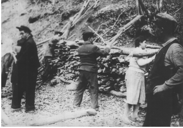
Կաղարծի գյուղի բնակիչները և ուսուցիչները դպրոցի համար փայտ են անում:

Դրանից հետո սկսվել են ընտանիքի չարչարանաց տարիները: Մայրը մնացել էր առանց աշխատանքի. ոչ մեկը չէր համարձակվում «ժողովրդի թշնամու» կնոջը գործ տալ: Կերակրողին կորցրածի թոշակ էլ չէին նշանակում: 8-14 տարեկան երեք երեխաներին Բաքվում ապրող ծնողներն են տարել