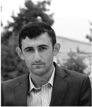
Ռոբոտաշինության խմբակավար, Ծմակահողի «Պատանի բնագետներ» ամառային դպրոց- ճամբարի նախաձեռնող խմբի անդամ, ուսումնական ծրագրի համակարգող:

Աշխատում է «Ես» կրթական ծրագրի վրա, ինչը նոր մոտեցում, նոր մշակույթ է խոստանում կրթության ոլորտում և ոչ միայն: