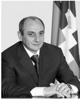
Սիրելի՛ հայրենակիցներ, Արցախի իշխանությունների և անձամբ իմ անունից ի սրտե շնորհավորում եմ ձեզ Արցախի Հանրապետության օրվա առթիվ:

1991 թվականի սեպտեմբերի 2-ը չափազանց կարևոր եւ հիշարժան օր է մեր ժողովրդի կյանքում, քանի որ ազատ եւ անկախ հանրապետության հռչակումը հիմնովին ու արմատապես փոխեց մեր պատմության ընթացքը: Այլեւս մեր ճակատագիրը մեր ձեռքերում էր, մենք էինք մեր ապագայի տերն ու կերտողը: Մեր սերունդն ստանձնեց հսկայական պատասխանատվություն՝ ինչպես մեր նախնիների հիշատակի առջև, այնպես էլ հետագա սերունդների, մեր հայրենիքի եւ համայն հայության ապագայի համար: