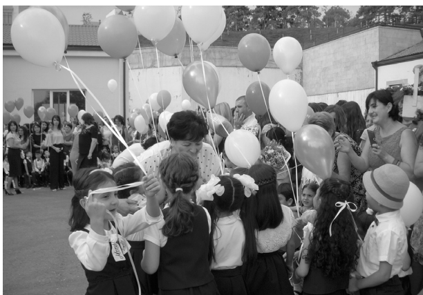
Կանչում է մեր ապագան, Բացվել է հրաշք ծիածան...