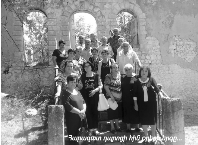
Հարազատ դպրոցի հին օրերի երգը...

Որ օգոստոսի 18-ը մեզ համար դառնալու էր մեր կյանքի պատմության լուսավոր ու անմոռաց էջը, դրանում համոզված էինք: Ու բոլորիս թվում էր (հետո բոլորը հաստատեցին այդ փաստը), թե ամեն մեկս այդ օրը մի մտնում ու պատասխանատու քննություն էր հանձնելու, և հուզվում էինք դրա համար: