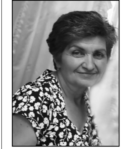
Անսպասելի լուրը ցնցեց բոլորիս...

2018թ. օգոստոսի 10-ին ողբերգական ավտովթարի զոհ դարձան 35-ամյա որդին և մանկավարժ 60-ամյա մայրը: