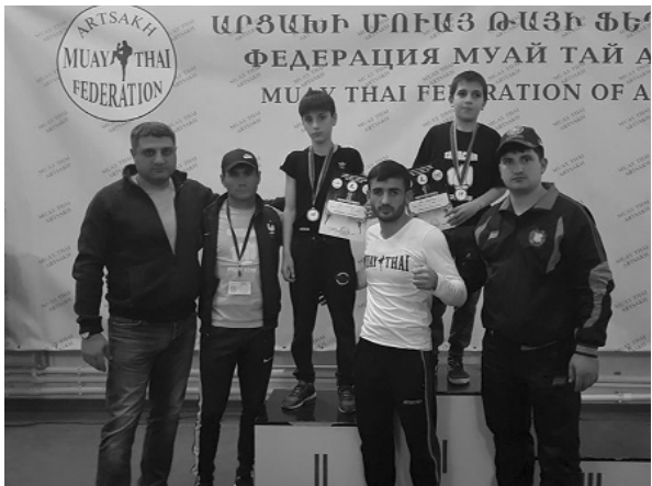
կասեցնում է նրա ցանկացած շարժում: Մարտից առաջ մարզիկների կողմից կատարվող ավանդական արարողակարգը

որ, ծնկները, բռունցքներն ու արմուկները՝ մուայթայի մարտիկը հակառակորդին է ուղղում հարվածների տարափ, ինչի շնորհիվ