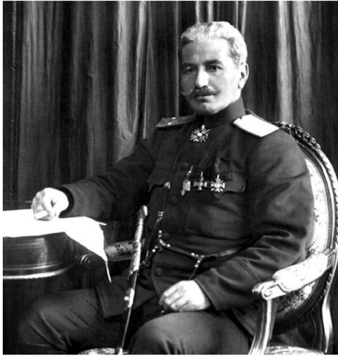
Հայ ֆիդայիների ըմբոստ ճակատները մենք դեռ պետք է համբուրենք...