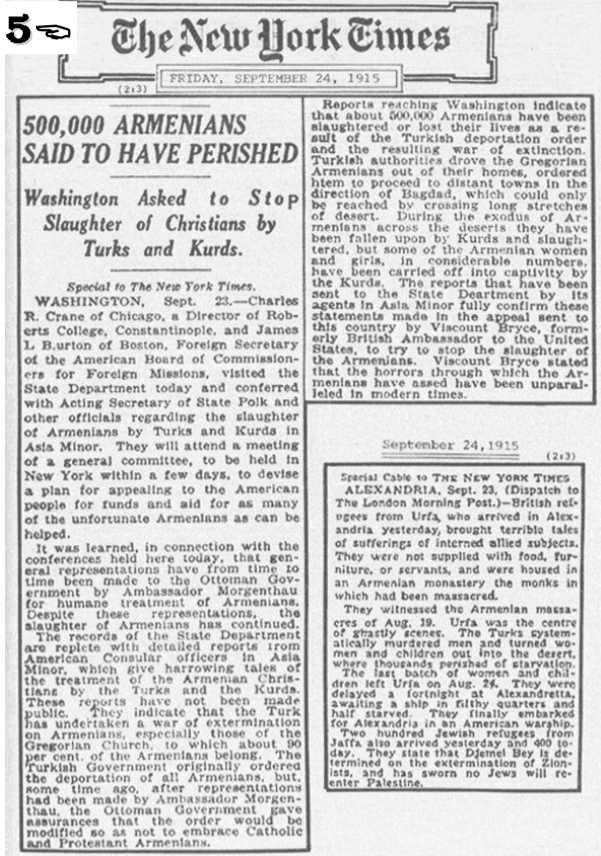
ԼԵՆԻՆ Ա. ՂԵՎԻՍ ԳՅՈՒՄԱՏՈՒՄ «Հայերի բնաջնջումը» - Ինդիպենդենթ, սեպտեմբերի 27, 1915թ

Կոտորածի, չարչարանքի և արտաքսման սարսափելի լուրով հայ քրիստոնյաները հատուկ խնդրանքով դիմել են ամերիկացիների կարեկցությանը և օգնությանը: Թուրքիայում բազմաթիվ և ստույգ աղբյուրներից հայտնի դարձավ, որ դա անկարգ ու անընչառ հարստահարում է, բայց սխտեմատիկ ջարդերը տանում են դեպի հայ ցեղի բնաջնջումը: Հազարավոր ընտանիքներ վտարվեցին իրենց տներին և սովանախ եղան ճանապարհին: Քաղաքները և գյուղերը ազատվեցին իրենց բնակիչներից: Հատերի տանջանքների ենթարկեցին, շատերին էլ ստիպեցին կրոնափոխ լինել: Կանանց ընդգրկում էին հարեմների մեջ, իսկ երեխաները ստրկության էին վաճառվում: