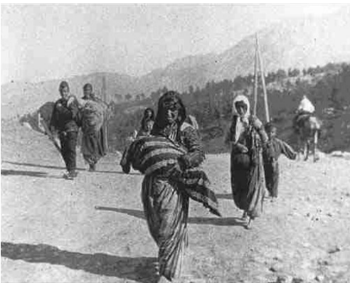
Հայ տարագիրներ, 1915 թ.: Armin T. Wegner. Wallstein Verlag, Germany.

Հայոց Մեծ եղեռնը համաշխարհային պատմության ամենացավոտ, ամենաողբերգական ոճրագործություններից է, մասնավորապես որ դեռևս չի ընդունվել թուրքական իշխանությունների