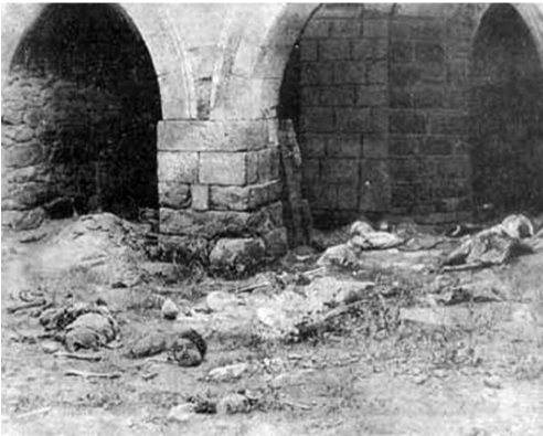
Հայկական վանք Բիթլիսի մոտ: Մոսկվա, համար 43, 20 նոյեմբերի 1916, տիտղոսաբերք: