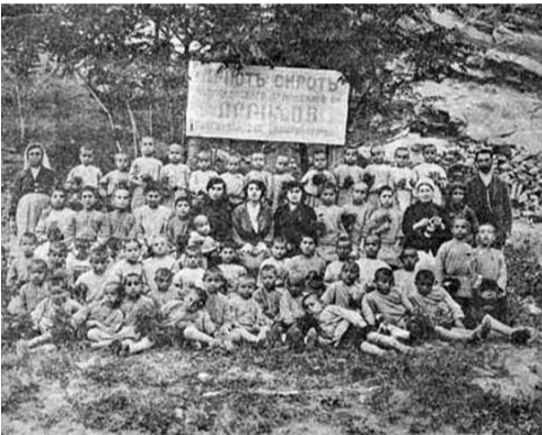
Աստրախանի հայկական միության որբանոցը: Մոսկվա, համար 27, 31 հուլիսի 1916, տիտղոսաբերք