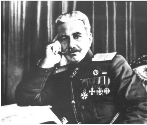
«Եթե հայերս իրավունք ունենք մեր անցյալը հերոսական անվանելու, և եթե հարատևել ենք որպես ժողովուրդ առ այսօր, ապա այդ բանում մենք մեծագույն չափով պարտական ենք Անդրանիկին»: