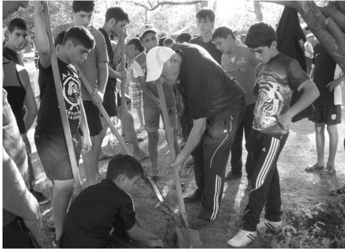
Կարևորը հաղթելը չէ, հաղթանակը պահելն է, սերնդափոխության ապահովումը: Եթե 1915թ. ունենայինք այսպիսի սերունդ, ծովից ծով Հայաստանը ձեռքից չէինք տալ» (փոխգործակետ Սարտին Բաղդասարյան):

«Երեխաներն այստեղ վարժվում են զինվորական նիստուկացին, բանակային բարոյահոգեբանական վիճակներին, քնելու, արթնանալու բանակի կանոնակարգին, ծանոթանում Արցախյան պատերազմում մեր տարած հաղթանակներին, ինչպես նաև դժվարություններին ու նահանջներին: Երեխաներին ամրագրում ենք ապրելու հայրենասիրության ոգով: Այս երեխաներից մենք ունենալու ենք հայրենասեր զինվորներ, հայրենասեր գիտնականներ, հայրենասեր հողագործներ, հայրենասեր մայրեր, մի խոսքով՝ հայրենասեր քաղաքացիներ» (զեներալ Սամվել Սաֆարյան):