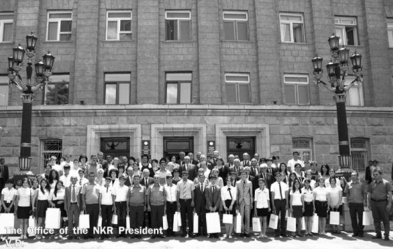
The Office of the NKR President

Արցախի Հանրապետության Նախագահ Բակո Սահակյանը հունիսի 18-ին հանդիպում է ունեցել 2014-2015 ուստարվա դպրոցականների առարկայական օլիմպիադայի Հայաստանի Հանրապետության եզրակալակիչ փուլում մրցանակային տեղեր գրաված ու գովասանագրերի արժանացած ԼՂՀ մասնակիցների եւ Արցախի պետական համալսարանը գերազանցության դիպլոմով ավարտած մի խումբ ուսանողների հետ: