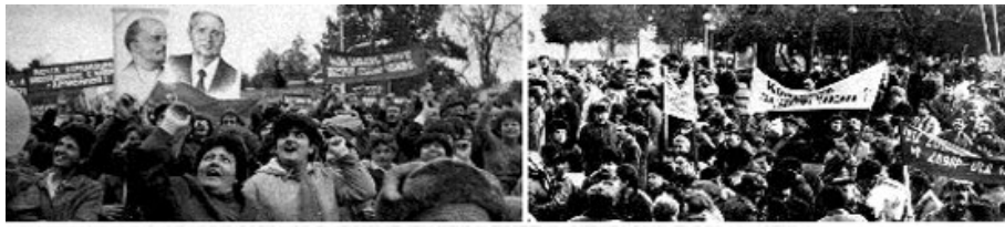
ԱՍԵՓԱՆԱԿԵՐՏ. 1988 Ձ. ՓԵՏՐՎԱՐ