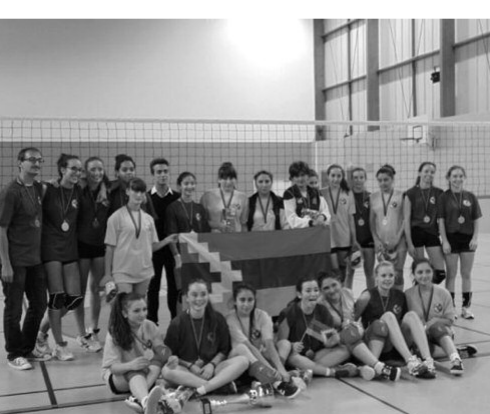
Այնուհետև նրանց հյուրընկալեց Մեդոնի թաղաքապետը և նախաճաշ կազմակերպեց

Նրանց համար էքսկուրսիաներ կազմա- կերպվեցին դեպի Եֆեյան աշտարակ, Նո- տերդամ Դե Պարի /Աստվածամոր տաճար/, Վերսայան պալատներ: Ճամփորդեցին Սե- նայի վրայով և ամբողջ Փարիզով: