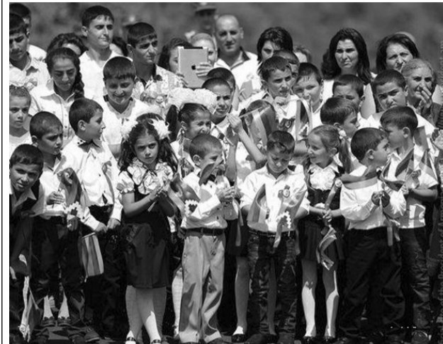
Հանրապետության 219 հանրակրթական ուսումնական հաստատությունները սեպտեմբերի 1-ին իրենց դռները բացեցին ավելի քան 21 հազար դպրոցականների առջև: Առաջին զանգի խորհուրդը առանձնահատուկ նշանակություն ունեն Ստեփանակերտի հ.1 և հ.6 հիմնական, Մարտակերտի շրջանի Չափարի, Ասկերանի շրջանի Աստղաշենի, Քաշաթաղի շրջանի Արտաշավի միջնակարգ դպրոցներում, որոնք նոր ուսումնականը սկսել են նորակառույց դպրոցաշենքերում: