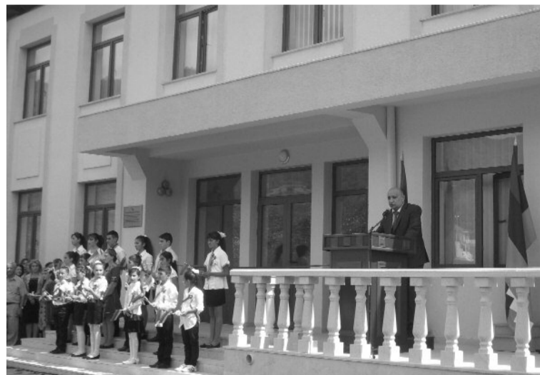
սպաս է դնում հարազատ բնօրրանի բարգավաճմանը: 2014թ. սեպտեմբերի 1-ը պատմական կղանջնա գյուղի համար: Նա հյուրընկալել էր հայկական երկու հանրապետությունների նախագահներին, Հայաստանի ու Արցախի բարձրաստիճան պաշտոնյաների, ակադեմիկոսների, հանրորեն ճանաչված շատ անձանց, ովքեր եկել էին կիսելու Չափար գյուղի բնակչության ու նրա արժանավոր գավակի՝ բարերար Վարուժան Գրիգորյանի ուրախությունը՝ կապված նոր դպրոցի բացման հետ: Պատվավոր հյուրերին աղուհացով դիմավորում են երեխաները: ՀՀ նախագահ Սերժ Սարգսյանը, Արցախի Հանրապետության նախագահ Բակո Սահակյանը, հանդիսության բոլոր մասնակիցները իրենց քայլերը նախ ուղղում են դեպի հուշահամալիր՝ գլուխ խոնարհելու Հայրենական մեծ պատերազմում և Արցախյան գոյամարտում նահատակված չափարցիների հիշատակին կառուցված հուշարձաններին: Դպրոցի ընդարձակ բակի երկու կողմերում կանգնած դպրոցականները հյուրերին ողջունում են ՀՀ և ԼՂՀ դրոշմներով: Հանդիսավոր հավաքը՝ նվիրված Չափարի Ա. Սաղյանի անվան միջնակարգ դպրոցի նորամուտին, բացում է գյուղապետ Վարդգես Սաղյանը: 2