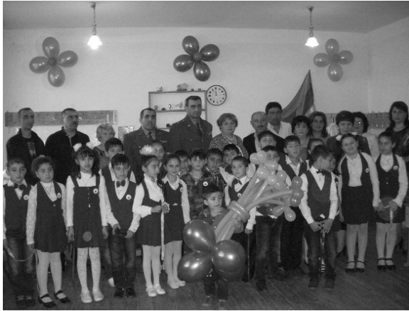
մեջ ու այդպես կշարունակվի: Ուրեմն՝ նրանք անմահ են:

կայացրեց հերոսների կենսագրությունը. երկուսն էլ զոհվել են շատ երիտասարդ՝ չհասցնելով ընտանիք կազմել: Այսօր նրանց մեծ ընտանիքը դարձել է իրենց դպրոցը, աշակերտները, որոնք երդում են տալիս նրանց անունով: Ասել է թե՛ նրանց կյանքը շարունակվում է այս փոքրիկների