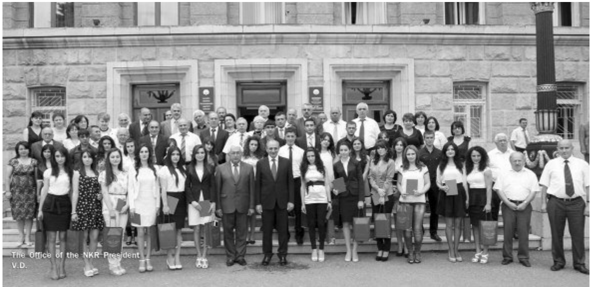
Ինչպես տեղեկացնում է Արցախի Հանրապետության Նախագահի աշխատակազմի տեղեկատվության գլխավոր վարչությունը, Նախագահ Բակո Սահակյանը հուլիսի 3-ին հանդիսավոր պայմաններում դիպլոմներ է հանձնել Արցախի պետական համալսարանը գերազանցությամբ ավարտած մի խումբ շրջանավարտների:

Իր խոսքում երկրի ղեկավարը գոհունակությամբ նշել է, որ Արցախի պետական համալսարանը գերազանցությամբ ավարտած շրջանավարտներին հանրապետության Նախագահի նստավայրում դիպլոմներ հանձնելու արարողությունը դարձել է բարի ավանդույթ՝ ընդգծելով, որ պետությունը ձգտում է ունենալ զարգացած ու ժամանակակից պահանջներին համապատասխանող կրթական համակարգ, եւ դա մեր առջեւ ծառայած առաջնային խնդիրներից մեկն է: