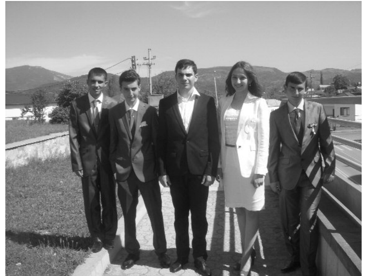
Կարծես երեկ էր, երբ դպրոցական առաջին զանգի դողանջների ներքո այս մանկանց համար բացվեցին դպրոցի հյուրընկալ դռները: Տասնմեկ տարի անց, դպրոցական վերջին զանգի ելևէջները սրտում, նրանք կրկին միասին կանգնել են կյանքի աստիճաններին: Հիմա արդեն հասունության դռներն են բացվել նրանց առջև, և թող Մեծ կյանք տանող ճանփան միշտ կանաչ լինի...