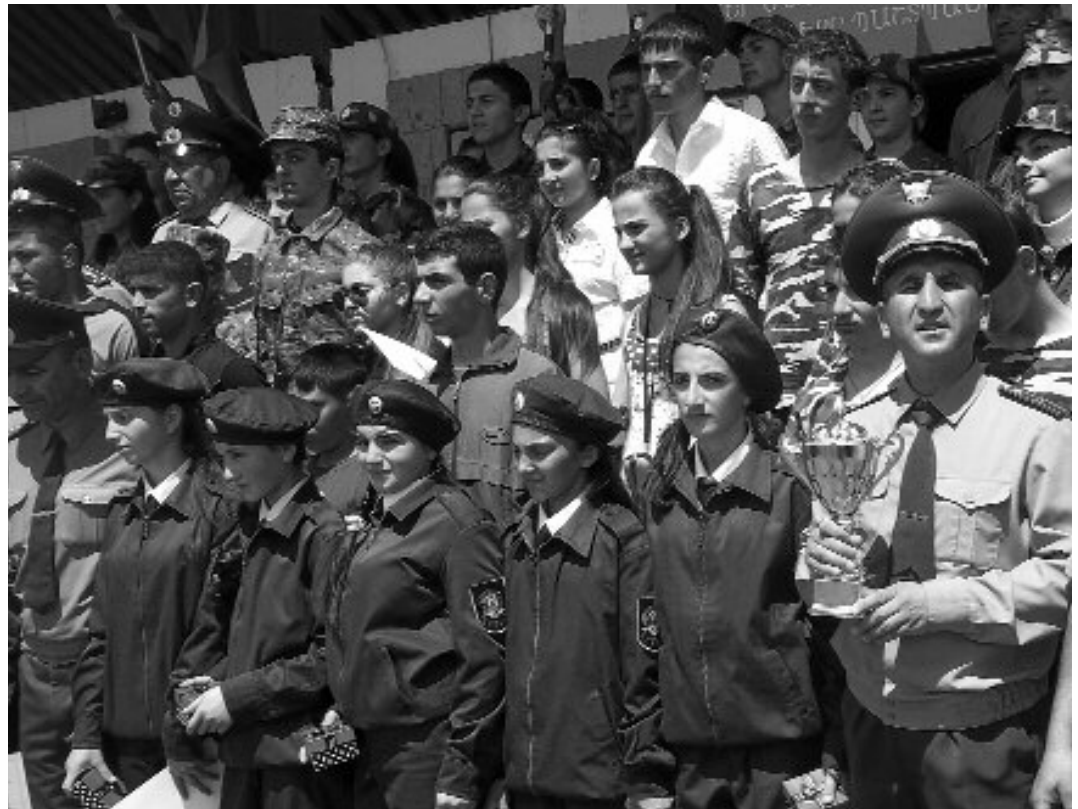
Սկարում.- «Նախնական զինվորական պատրաստություն» առարկայի հանրապետական օլիմպիադայում հաղթած Արցախի հավաքականը:

Իսկ մեր հայրենիքում հերոս են բոլորը՝ մարդիկ, լեռները, գետերը, բնակա-