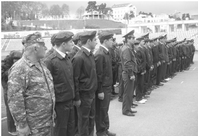
2013թ. «Արծվիկ»-ները. առաջին պլանում՝ հաղթող հ. 11 ավագ դպրոցի ջոկը: