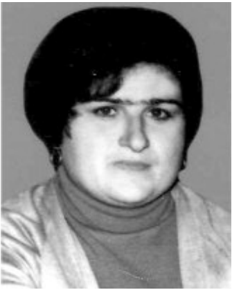
Բնությունը կնոջն ասել է գեղեցիկ եղի՞ր՝ եթե կարող ես, իմաստուն եղի՞ր՝ եթե ուզում ես, բայց ողջամիտ լինել՝ դու պարտավոր ես: