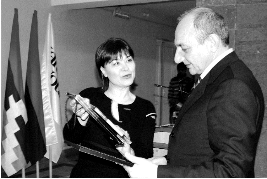
կալայի «Ղարաբաղյան վերքեր» ֆիլմաշարի շնորհանդեսը: Ներկա էին ԼՂՀ թեր, մշակույթի գործիչներ: Ֆիլմաշարն ընդգրկում է Արցախյան ազատամար-

տի վերաբերյալ ռեժիսորի յոթ վավերագրական ֆիլմ («Բարձունքներ, հույսեր»-1991թ., «Կրակի», արդյոք, առավուրդ Ղարաբաղում»-1992թ., «Իմ թանկահին ողջեր և մեռածներ»-1993թ., «Ղարաբաղի վերքերը»-1994թ., «Իրենց հողի զինվորները»-1994թ., «Լուսթյուն»-1995թ., «Հավատ ու ոգի»-2001թ.), որոնք ծայրագրվել են վեց լեզվով՝ հայերեն, ռուսերեն, բուլղարերեն, անգլերեն, ֆրանսերեն և իսպաներեն: Արցախի նախագահն ու բոլոր ելույթ ունեցողները բարձր գնահատեցին բուլղարացի կինոգործի նվիրումն ու դերը մեր երկրի համար ծանր ու դժվարին մի ժամանակաշրջանի իրական պատմությունը վավերագրելու, ազգային-ազատագրական պայքարը ճշմարտացի լուսաբանելու և աշխարհին ներկայացնելու գործում: Շնորհանդեսի ընթացքում հեղինակը ֆիլմաշարի հավաստագրված տեսասկավառակները հանձնել է Բ. Սահակյանին, իսկ միջոցառումն ավարտվել է ֆիլմերից երկուսի ցուցադրությամբ: