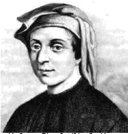
Լեոնարդո Պիզանո (Ֆիբոնաչի) Միջնադարի մեծագույն մաթեմատիկոս

Լեոնարդո Պիզանոն (Պիզայեցի) (լատիներեն՝ Leonardo Pisano) միջնադարյան Եվրոպայի առաջին խոշոր մաթեմատիկոսն էր։ Ավելի շատ նա հայտնի է Ֆիբոնաչի (Fibonacci) անունով։ Այս անվան ծագման պատմության շուրջ կան տարբեր վարկածներ։ Ըստ առաջին վարկածի, նրա հայրը՝ Գիլերմոն, հայտնի էր Բոնաչի («անձնվեր») անունով, իսկ ինքը՝ Լեոնարդոն, կոչվեց filius Bonacci (բառացիորեն՝ Բոնաչիի որդի)։ Ըստ մյուս վարկածի՝ Fibonacci-ն ծագում է Figlio Buono Nato Ci արտահայտությունից, որը բարձրանաբար նշանակում է «ծնողին արժանի զավակ»։ Ֆիբոնաչիի ծննդյան ճշգրիտ թվականը հայտնի չէ։ Ընդունված է համարել, որ ծնվել է 1170թ., մահացել՝ 1228թ.։ Ենթադրվում է, որ նա գտնվել է Ֆրիդրիխ Գոգենտաուֆեն կայսեր ղեկավարած խաչակրաց արշավանքներից մեկի ժամանակ։ Կայսր Ֆրիդրիխ Գոգենտաուֆենը, մեծանալով Սիցիլիայում և կրթվելով արաբական դպրոցներում, պաշտոն էր արաբական մշակույթը։