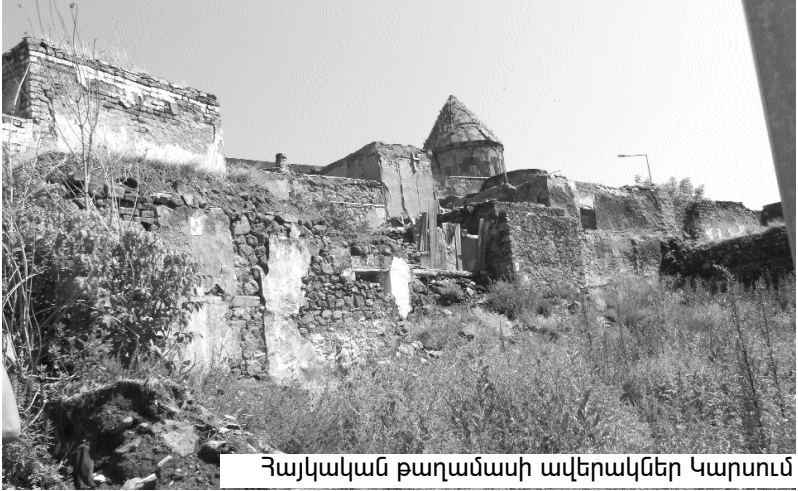
Հայկական թաղամասի ավերակներ Կարսում

Հայի ըմբոստ ոգին նորից դրան պատասխանեց... Ամեն մի «յալլա»-ին հաջորդում էր մի նոր բաժակաճառ՝ համեմված բանաստեղծություններով, պատասխան գոչերով: Մո-