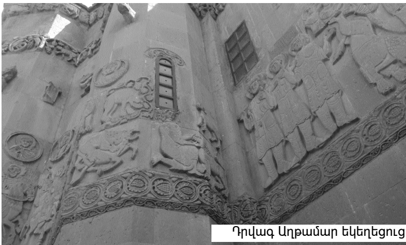
Դրվագ Աղթամար եկեղեցուց

Խաչակնքվեցինք... Խոսում էինք Աստծո հետ և մեր սրտի մորմոքը կիսում: Յուրաքան-