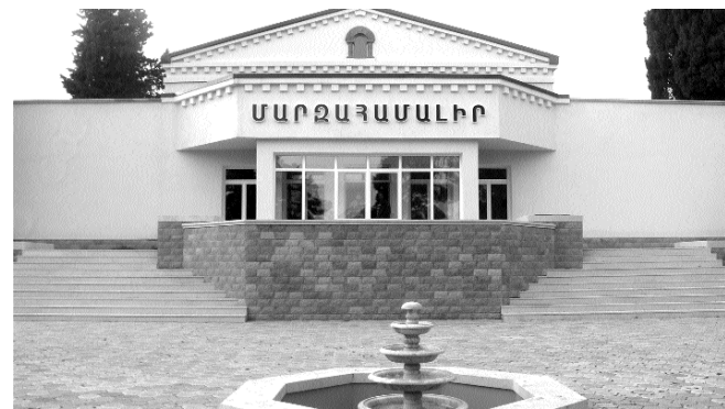
որտեղ կկոփվի ոգու և մարմնի զորությունը: Մարտունու շրջանի պատանիները միշտ էլ հաղթանակներով են փայլել տարբեր մարզաձևերում: Ունենալով նոր ու հարմարավետ տարիքի մարզիկների թիվը: Երեխաների մեծ մասը տղաներ են, որոնք հայրենիքի վաղվա զինվորներն են լինելու, և

Այսուհետ «Առողջ մարմնում» առողջ հոգի» արտահայտությունը Մարտունու մարզիկների համար կդառնա կարգախոս: Նոր՝ 2012թ. սկզբին մարտունեցիներին մեծ նվեր մատուցվեց. բացվեց Մարտունու քաղաքի մարզահամալիրը՝ մարզիկներին հնարավորություն ընձեռելով տարբեր մարզաձևերում իրենց ուժերն ու հնարավորությունները փորձելու: Քաղաքի տաղանդաշատ մարզիկները, ովքեր մինչև մարզադահլիճի կառուցման ծրագրի իրականացումն էլ փայլում էին իրենց ելույթներով հանրապետության ներսում և նրա սահմաններից դուրս, այժմ ավելի բարվոք ու նպաստավոր պայմաններում կկատարելագործվեն: