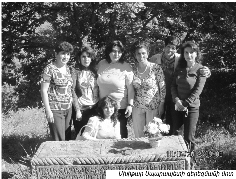
Մխիթար Սպարապետի գերեզմանի մոտ

Ինչպես միշտ, մեր ճանապարհն անցնում է Հայաստանի սրտով, որից հետո երակները պիտի տանեն մեր նպատակադրած ճանապարհորդության արահետներով: Մեր առաջին կանգառը Խնձորեսկ գյուղն էր: Բնականաբար, մեր քայլերը տարան դեպի Մխիթար Սպարապետի գերեզմանը: Ցավալից այն է, որ շատերը չգիտեին տեղի մասին, և մեզ դժվարությամբ հաջողվեց ճշտել տեղը. մի խոր ծորում մանուկալած ուղղանկյունաձև անշուք տապանաքար էր, շուրջը՝ անտարբերության մատնված: Ի հեճուկս մարդու՝ բնությունն ավելի էր գնահատում մեծն սպարապետին. ամենուրեք բուրում էին յասամանները: Մեր հուզմունքն անչափ մեծ էր, և մտածում էինք միայն մի հարցի շուրջ. մի՞թե նա չի ունենալու իր հուշարձանկոթողը, չէ՞ որ պատմության մասին վկայում են նաև քարերը: