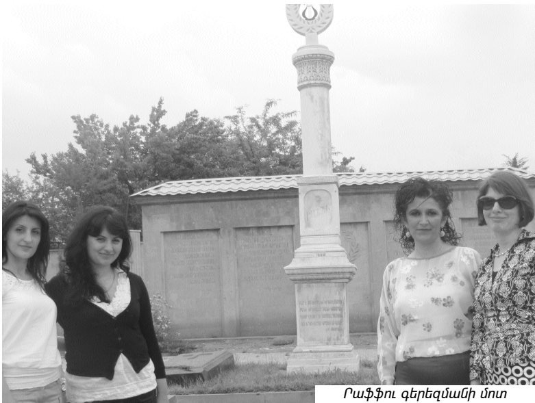
Րաֆֆու գերեզմանի մոտ

Ճանապարհորդության առաջին իսկ րոպեներից մեզ գերել էր Սյունիքի բնությունը: Երբ խուճուխ իջավ ծորը՝ ծաղկեպսակ դնելու Հայոց Սպարապետ Մեծն Մխիթարի (այդպես է գրված նրա տապանաքարին) գերեզմանին, քարացել էինք կախարհական, «վայրի» բնության տեսքով: Հորդառատ անձրևներից հետո ծորը փարթամացել էր, պատվել զմրուխտ կանաչով: Յասամանի թփերն էին տեղ-տեղ ծաղկել և իրենց կախարհական ու աստվածային բույրով լցրել ծորը: Թռչունների վաղ առավոտյան դայլալը, սառն ու մաքուր օդը, աչք շոյող կանաչը